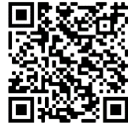
Bild: Postkarte und QR-Code zur Website